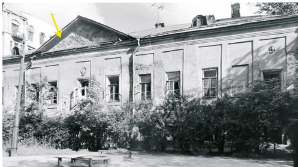
Рис. 9. Жилой дом А.В. Сухова-Кобылина, конец XVII – XVIII вв. Москва, Большой Харитоньевской пер., 17/13. Фото 1957 г. (Дом с палатами)

Возрождение подлинной архитектуры данного памятника началось в середине XX в. под руководством Петра Дмитриевича Барановского ( Барановский 1996 ), в результате чего постройка получила свой первоначальный облик. А в качестве напо-