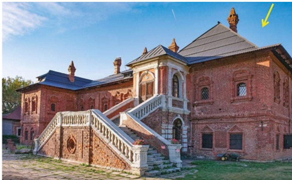
Рис. 8. Дворец митрополитов Крутицких. XVII в. Южный фасад после реставрационных работ середины XX в. Москва, ул. Крутицкая, д. 17, стр. 3. (Крутицкое подворье)

раскрыть первоначальный облик здания, сохранив более поздние фрагменты архитектурных напластований. Ярким примером применения подобной концепции являются построенные при митрополите Павле III Митрополичьи палаты — дворец Крутицких митрополитов в Москве ( Московские шедевры ), которые, так же как и исследуемое здание, неоднократно перестраивались ( Одинцов ). В итоге таких