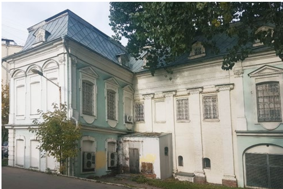
Рис. 11. Дом Долгоруковых. 1764 г. Москва, Колпачный пер., 6, стр. 2. 2022 г.

видеть и в структуре других древних сооружений. Например, Жилого дома А.В. Сухова-Кобылина в Большом Харитоньевском переулке, в основе которого лежат палаты XVII столетия ( От старинных палат ). В судьбе данного сооружения также можно отметить глобальные преобразования, происходившие в эпоху классицизма ( Дом недели ) (рис. 9).