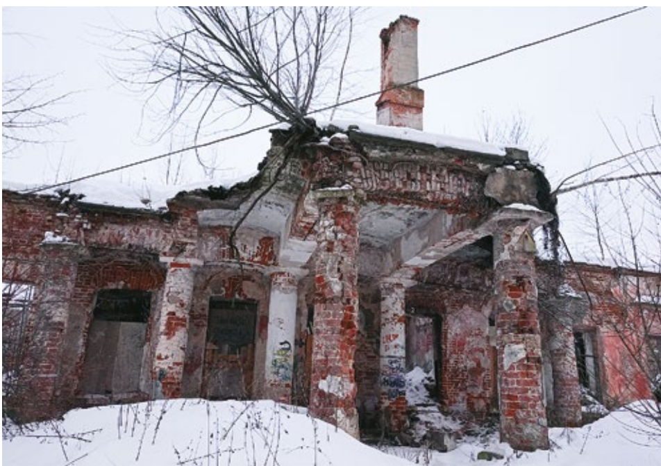
Рис. 4. Главный дом усадьбы Безобразовых. Входная группа главного фасада. Существующее состояние. Московская область, Волоколамский район, с. Ивановское. Фото Т.В. Иванцыка, 2023 г.

объема и декоративно-художественного оформления, датированного первой половиной XIX в. В качестве частично сохранившихся фрагментов классицистического периода можно отметить портик с колоннами и центральную часть северного фасада. В интерьерах к частично сохранившимся фрагментам можно отнести вестибюль главного входа, оформленный