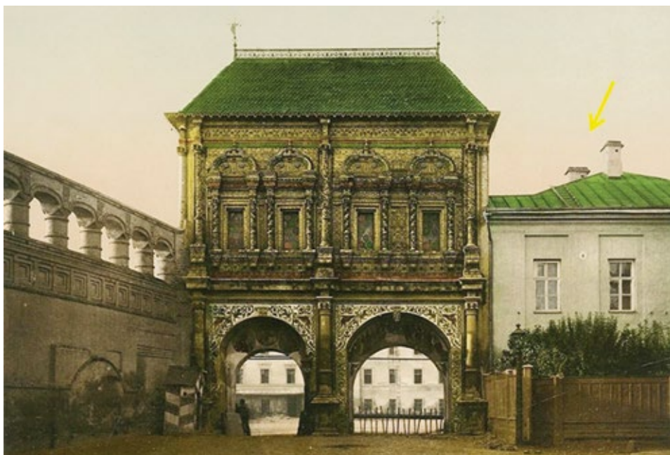
Рис. 7. Дворец митрополитов Крутицких. XVII в. Северный фасад до реставрационных работ середины XX в. Москва, ул. Крутицкая, д. 17, стр. 3. Фото 1900–1910 гг. (Крутицкий теремок)

Рассматривая примеры реставрационных работ прошлых лет, можно отметить ряд построек, при реставрации которых был применен аналогичный прием реставрационной практики, позволивший