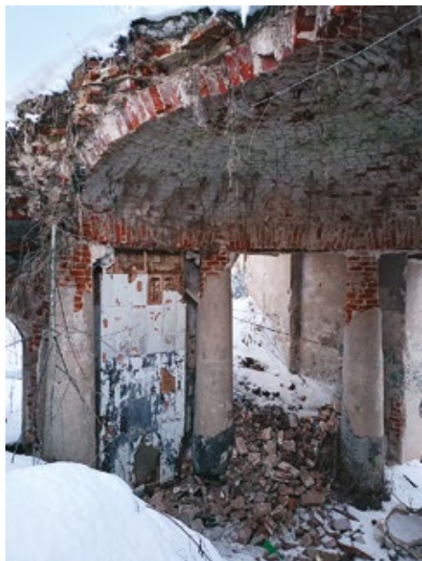
Рис. 5. Главный дом усадьбы Безобразовых. Интерьер вестибюля главного входа. Существующее состояние. Московская область, Волоколамский район, с. Ивановское. Фото Т.В. Иванцыка, 2023 г.

кольцом колонн с купольным завершением. Несмотря на то что данные фрагменты также имеют значительные разрушения и утраты, их стилиобразующие формы еще присутствуют в натуре в той или иной степени сохранности, что позволяет принять меры по их дальнейшему сохранению.