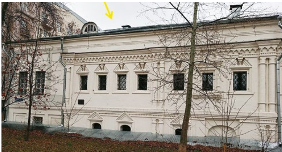
Рис. 10. Жилой дом А.В. Сухова-Кобылина, конец XVII – XVIII вв. Москва, Большой Харитоньевской пер., 17/13. Фото Т.В. Иванцыка, 2023 г.

минания о богатой строительной истории у южного фасада здания было сохранено крыльцо с ажурной парадной лестницей, представляющее более поздний период в истории сооружения и выполненное в середине XVIII в. в стиле барокко ( Одинцов ) (рис. 8).