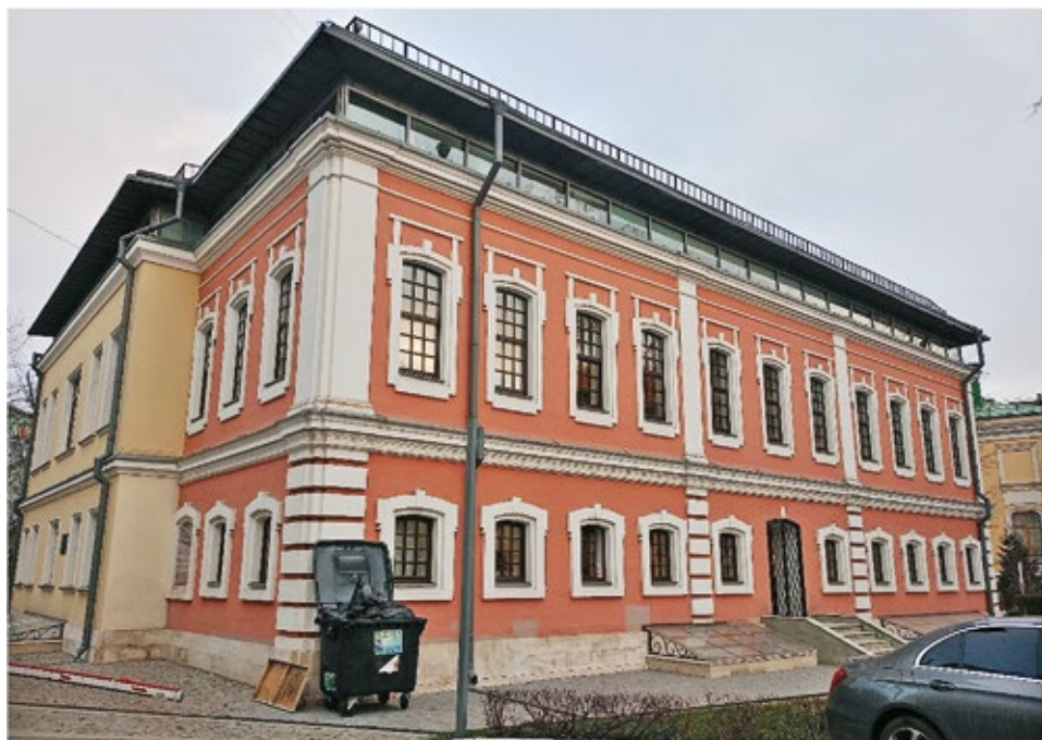
Рис. 12. Жилой дом. XVIII век. Москва, Тверская ул., 5А.

Однако впоследствии при выполнении ремонтно-реставрационных работ памятнику возвратили его исторический облик, оставив лишь небольшой фрагмент классицистической пристройки (рис. 10). Подобную картину можно видеть и на фасадах дома Долгоруковых в Колпачном переулке (рис. 11), и жилого дома XVIII в. на Тверской (рис. 12), а также на ряде других построек, в основе которых лежат древние памятники архитектурного искусства.