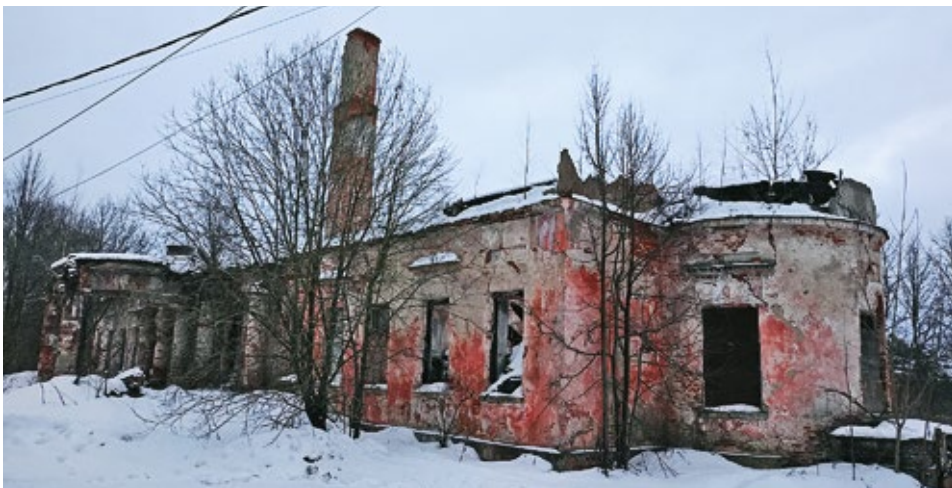
Рис. 3. Главный дом усадьбы Безобразовых. Вид с северо-запада. Существующее состояние. Московская обл., Волоколамский район, с. Ивановское. Фото Т.В. Иванцыка, 2023 г.

щее состояние памятника и оценить степень сохранности элементов постройки тех или иных строительных периодов (рис. 4, 5). В целом, как было сказано ранее, сохранившееся к настоящему времени сооружение пребывает в руинированном состоянии. В связи с чем можно констатировать практически полную, а в случае со вторым этажом и кровлей полную утрату